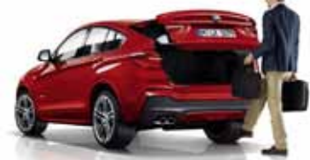
ラゲージスペースは500L、バックレスとを倒すと1400Lに拡大。使いやすいスマート・オープン/クローズ機能付き。