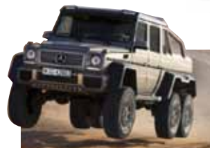
究極の走破性を誇る、MercedesBenz G63 AMG 6×6

マツシマホールディングス各ブランドの最新モデルから、100台以上の中古車を展示即売するモーターショーが開催されます。MercedesBenz G63 AMG 6×6やBMW i8をはじめ、普段お目にかかれないレアな車もラインナップ。さらにヒストリックカーの展示も注目です。