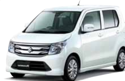
フロント周りを中心に大幅にデザインが変更になった新型ワゴンR FZ(¥1,394,280~)。車の骨格となる車台を15%軽量化し、さらに燃費性能も高めています。

No.1となる低燃費32.4km/Lを達成。さらにスターターモーター機能により、アイドリングストップから静かでスムーズなエンジン再始動も実現しました。大ヒット軽クロスオーバー「ハスラー」に続き、軽市場でまたまた話題を集めます。