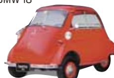
フロント1枚ドアが独特。往年の名車、BMW Isetta