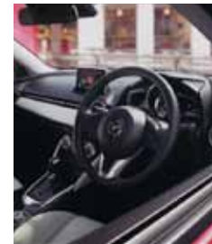
コンパクトカーの中では群を抜いて上質感あるインテリア。SNSなどと接続できる「マツダコネク」も装備。

知・判断をサポートする先進の安全装備も充実。セグメントの常識を超える高い機能と価値を提供しています。9/11~予約開始。