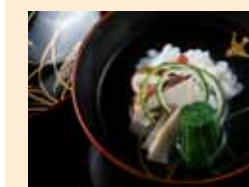
秋の美味、鰻と松茸の焼物。

伝統的な京町家で四季折々の懐石料理がいただける近又。店内はしっとりとした庭を囲むように、書院風の座敷席やモダンな椅子席が設けられた風雅な空間です。香り高いだし味わいと吟味された素材、そして見事な調度品や器の数々まで、まさに総合芸術の世界を堪能いただけます。秋は名残の鰻、松茸、くじ、そして蟹などの美味が目白押し。鶴飼さんの温かなおもてなしも心とむひとときを演出してくれます。