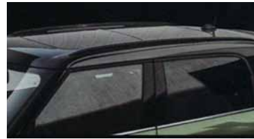
ジャングル・グリーン・メタリックをはじめ、3つの新色がラインナップ。全モデルにオプション装着可能。写真はクールなピアノ・ブラック・エクステリア。

人気の4ドアモデル、MINIクロスオーバーのマイナーチェンジに伴い、今秋クリーンディーゼルモデルが誕生します。1995cc/4気筒ターボディーゼルエンジン搭載した、COOPER D CROSSOVER、ALL4、SD CROSSOVERの3モデル。これまで以上にトルクフルな走りや高い環境性能を実現。経済性にも優れたディーゼルモデルでゴーカートフィーリ