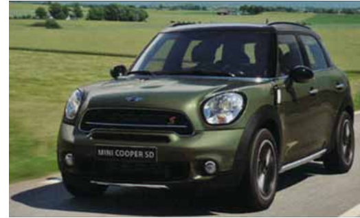
さらに力強く、洗練されたニューMINI COOPER SD CROSSOVER、車両本体価格 ¥3,900,000。