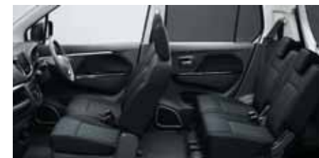
コンパクト設計のハイブリッドシステムで、広い室内空間を確保。