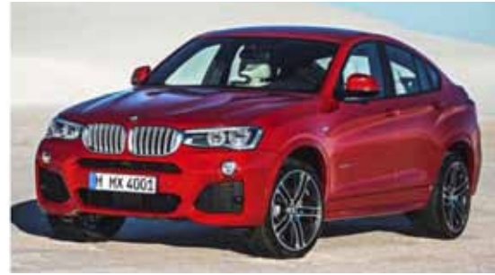
2L直列4気筒ツインパワー・ターボエンジンを搭載したxDrive28iと、3L直列6気筒ツインパワー・ターボエンジンxDrive35iにM Sportsがラインナップ。車両本体価格¥6,740,000~