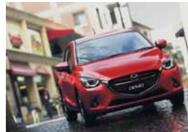
高さが2.5cm、長さが16cm大きくなり、スマートになった新型デミオ 1.5L SKYACTIVE-D ¥1,782,000~。ガソリンエンジンの1.3L SKYACTIVE-Gは¥1,350,000~。

SKYACTIVEテクノロジーの第4弾となる、新型デミオ。最新の魂動デザインを踏襲した躍動感あるエクステリアは、Aピラーを後ろにひき、キャビンに凝縮したスマートなフォルムが印象的です。注目はクリーンディーゼルエンジンを搭載した1.5L SKYACTIVE-Dが新登場。リッター26.4kmという高い燃費と環境性能を備えながら、2.5Lガソリンエンジン並のトルクフルな走り、高回転までリニアに加速する優れた動力性能を実現しています。ドライバーの危険認