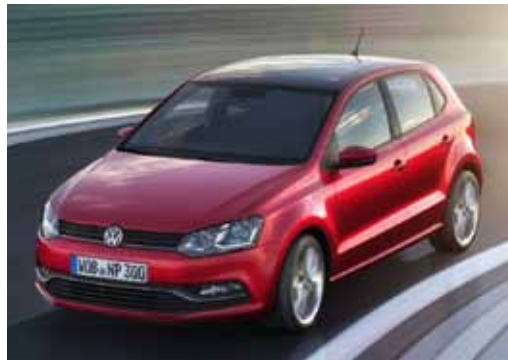
VW最新のデザインを取り入れ、より精悍になったエクステリア。写真のサンセットレッド・メタリックの最新色3色を含む、7つのカラーがラインナップ。車両本体価格¥2,250,000~