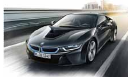
次世代のハイブリッドスポーツカー、BMW i8