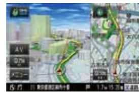
Googleと連携した、Intelligent VOICE。スマートフォンを介してクラウドサーバから対話式で検索できます。